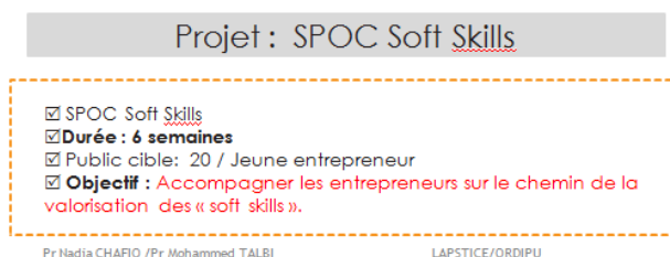
Fig.3. Description du projet SOFT SKILLS

débuté le 15 décembre 2016 sur la plate-forme Moodle (voir Fig.3.), pour une durée de 6 semaines pour un public cible de 20 entrepreneurs. Le groupe ayant une taille limitée et on retrouve les mêmes personnes tout au long du parcours de formation. Le cours consiste en une série de courtes vidéos, de diapositives, des quizz et des projets créatifs.