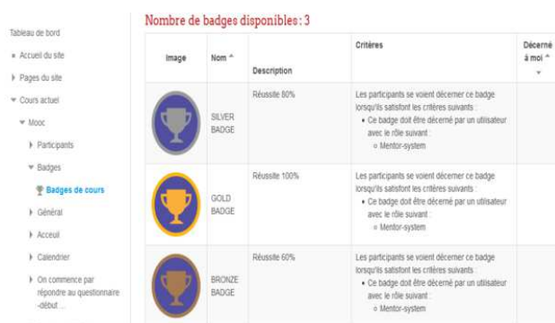
Figure.4. Captures d'écran des types de badges

Un badge est un dispositif numérique qui se présente sous forme d'icône et qui valide l'acquisition d'aptitudes, de savoir faire ou de compétences 1 . Les entrepreneurs peuvent remporter trois types de badges selon les composantes des compétences requises en Soft Skills. Les badges ont différents niveaux d'acquisition. Pour les badges du SPOC Soft Skills, il y a 3 niveaux : bronze, argent et or (voir figure 2).