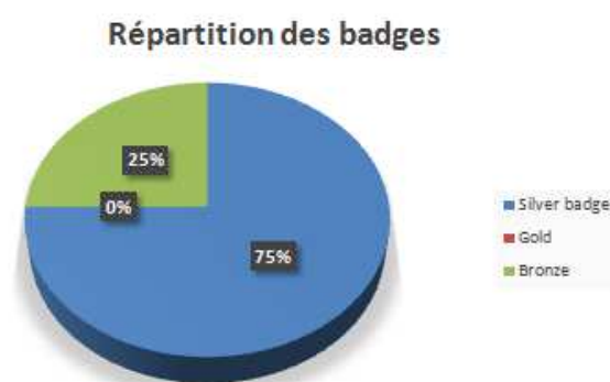
Figure 3: Répartition des badges : Silver/Gold/Bronze

Les bas taux d'achèvement (c-à-d les 75% des entrepreneurs ayant les badges silvers) sont souvent critiqués. Or, l'atteinte d'un objectif personnel d'apprentissage n'implique pas nécessairement de compléter tout le cours. Par exemple, le besoin d'appui à l'apprentissage pourrait être satisfait par l'achèvement d'une partie bien précise du cours offert 2 . Les mesures