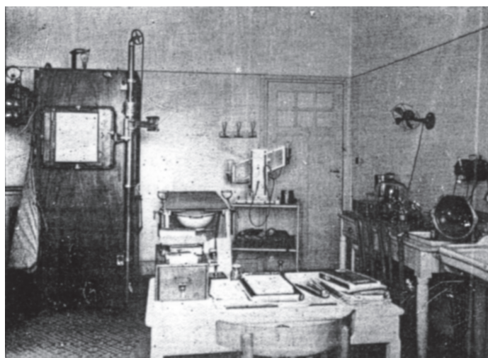
Cabinet de consultation du Dr. Lapin