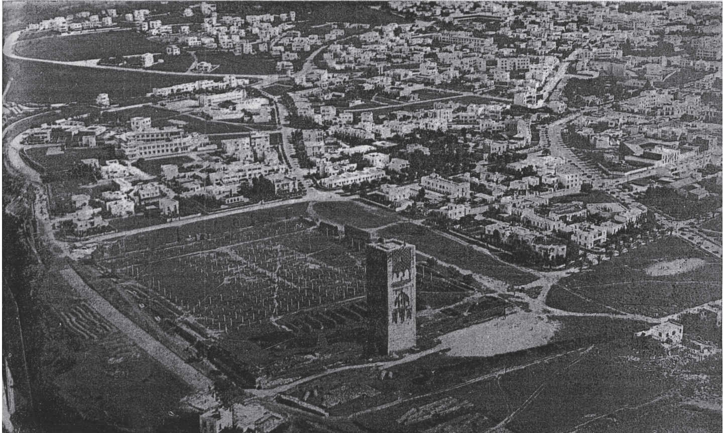
Vue générale de Rabat - Au premier plan les ruines de la mosquée Hassan

Le bureau d'Hygiène de la ville de Rabat exerce son activité sur les organisations sanitaires suivantes :