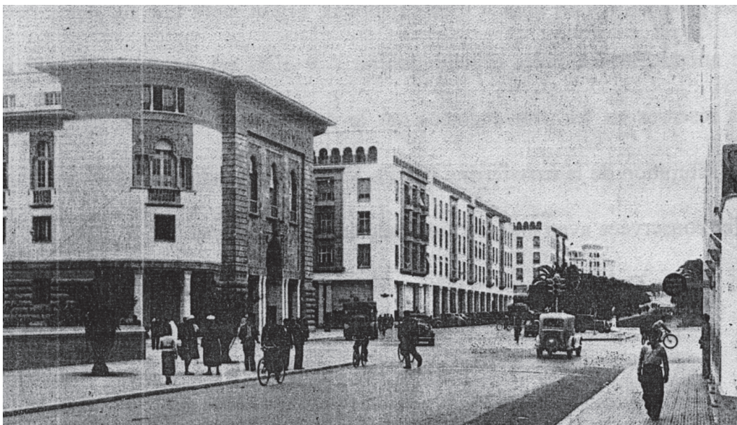
Le cours Lyautey