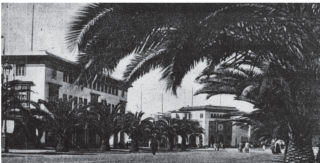
La trésorerie générale et la poste

où sont consignées et traitées les femmes inscrites sur les registres du service des mœurs et reconnues malades à la visite hebdomadaire ;